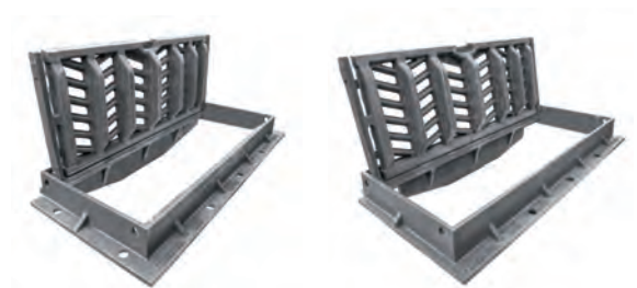
AQUAVA cadre nervuré